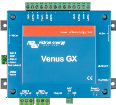
Venus GX mit Steckern