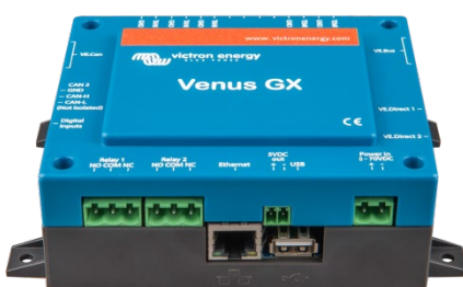
Venus GX Vorderansicht