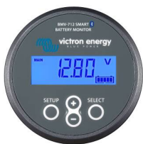
Détection Bluetooth : Contrôleur de batterie BMV-712 Smart