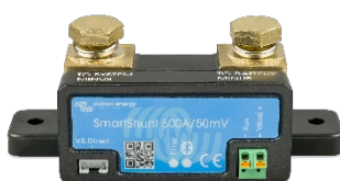
Bluetooth sensing: SmartShunt