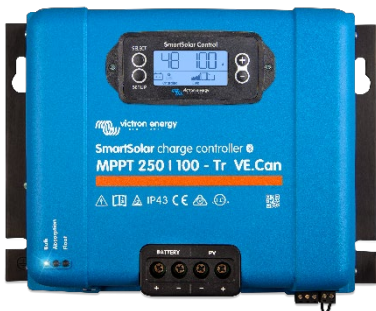
Contrôleur de charge SmartSolar MPPT 250/100-Tr VE.Can avec écran à brancher en option