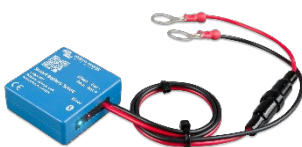
Détection Bluetooth : Sonde Smart Battery Sense