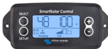
Écran à brancher SmartSolar