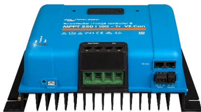
Contrôleur de charge SmartSolar MPPT 250/100-Tr VE.Can sans écran