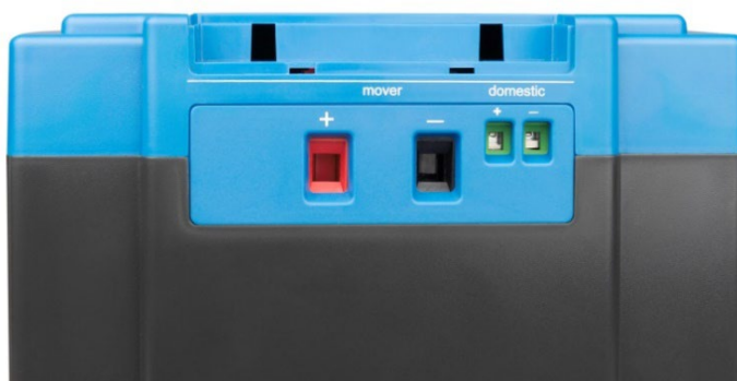
Hochleistungsausgang (Mover) und Niedrigleistungsausgang (Domestic)