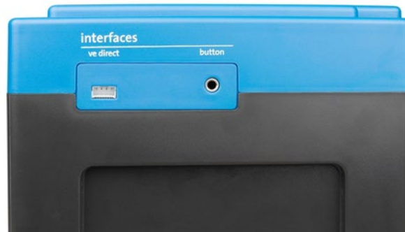
VE.Direct und Druckknopf