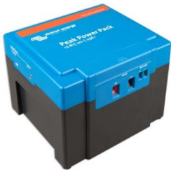
12,8 V, 20 Ah