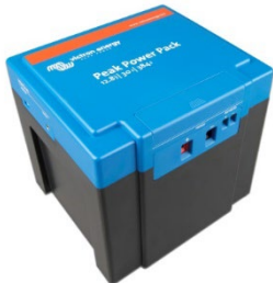
12,8 V, 30 Ah