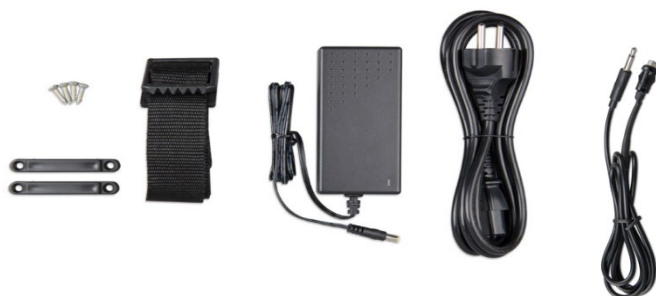
Befestigungsriemen Adapter Stromkabel Druckknopf mit Kabel (2 m) und zweifarbiger LED