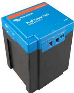
12,8 V, 40 Ah