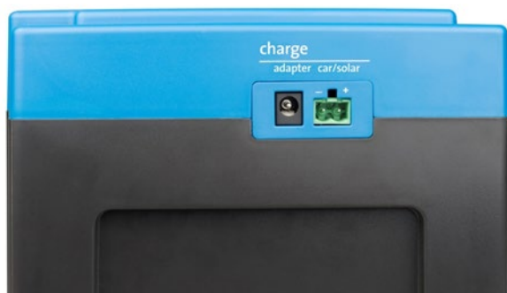
Adapter und Eingänge Fahrzeug/Solarmodul (Car/Solar) (Buchse für den Car/Solar-Eingang wird mitgeliefert)