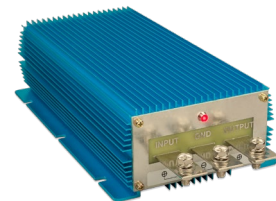
Orion IP67 24/12-100 Orion IP67 12/24-50