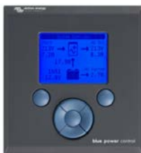
Tableau de commande Blue Power

Un solution pratique et bon marché pour une surveillance à distance, avec un bouton rotatif pour configurer les niveaux de Power Control et Power Assist.