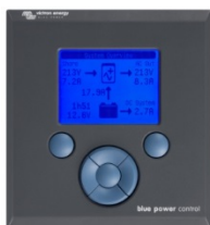
Tableau de commande Blue Power

Une solution pratique et bon marché pour une surveillance à distance, avec un bouton rotatif pour configurer les niveaux de Power Control et Power Assist.