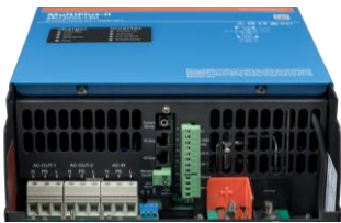
Zona de conectare MultiPlus-II 3k