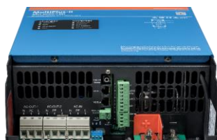
Zona de conexión MultiPlus-II 4k5