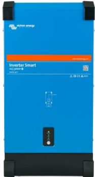
Invertor Smart 12/3000