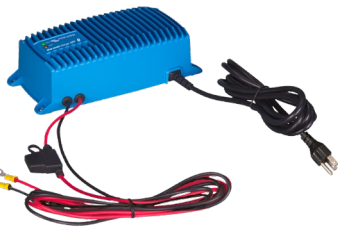
Chargeur Blue Smart IP67 12/25