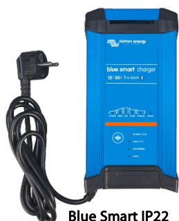
Blue Smart IP22 12/30 (3)