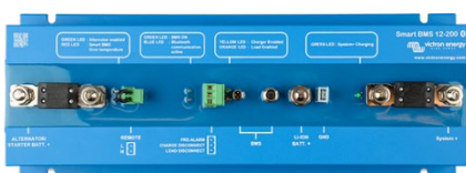
Smart BMS 12/200