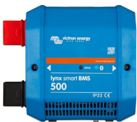
Lynx Smart BMS