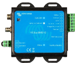
VE.Bus BMS V2