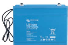
Lithium Battery Smart 12,8 V & 25,6 V