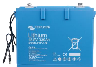
Batería LiFePO4 de 12,8V 330Ah