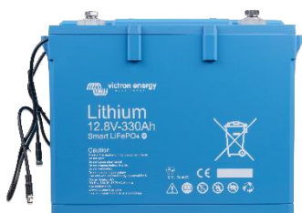
12,8V 60 Ah LiFePO4-Batterie